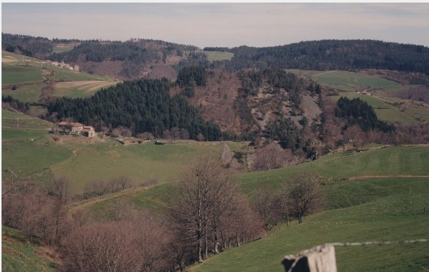
Vue sur le village de Graix